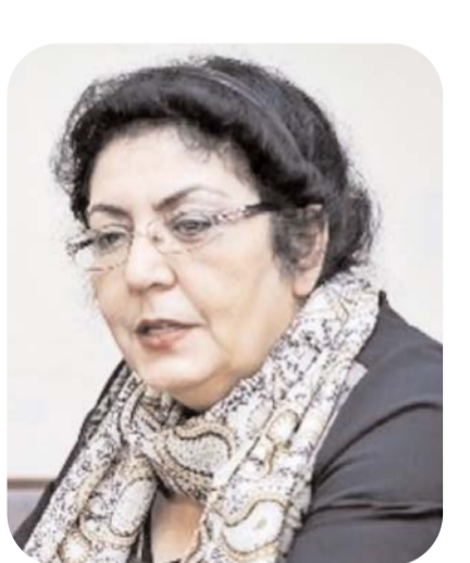
Məni bağışlama, qurbanın olum, bağışlama məni, qoy çıxım gedim.

Baxma səvgi yağın baxışlarınla, mən sənin dünyanı yıxıb gətmişəm. Sən həsrət qaldın baxışlarıma, özgə bir dünyanı yıxıb gətmişəm.