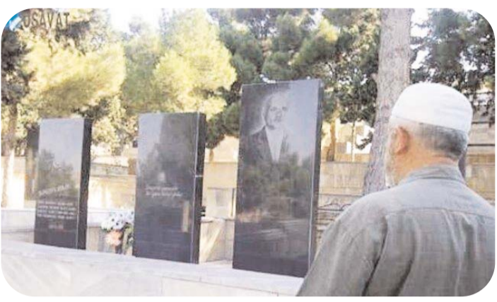
Heç Seyid Əzim Şirvaninin təsvir elədiyi mollalarla bugünkü bəzi mollalarımız arasında heç bir fərq yoxdur. Biri deyir ki, 200 manat ver, gəlim rəhmətə gedni yerdən götürüm, biri deyir ki, 300 manat ver, gəlim məclisi aparım, biri də deyir ki, özünü bilirsiniz, mən savadlı adamam, haqqım da yük-səkdə. İndi gəl belə mollalardan baş aç görüm necə açırsın. Heç əvvəlki mollalarla indiki mollaların tamahları da dəyişməyib.

Bir çox mollalar isə qonşu ölkənin təsiri altına düşür. Heç özü də bilmir ki, nə istəyir. Və ən qəribəsi odur ki, bu cür mollalar düşü-nürlər ki, nəyin bahasına olursa-olsun, hardan bir şey qoparaçaqlar. Onlar üçün nə Allah, nə peyğəmbər, nə də "Quran" anlayışı var. Onlar üçün bir anlayış var - pul qazanmaq.