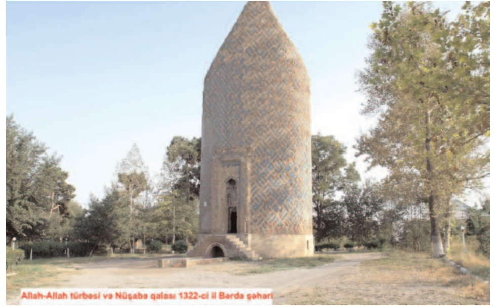
Allah-Allah türbəsi və Nüşaba qalası 1322-ci il Bərdə şəhəri

AZƏRBAYCAN RESPUBLİKASININ PREZİDENTİ YANINDA KÜTLƏVİ İNFORMASIYA VASİTƏLƏRİNİN İNKİŞAFINA DÖVLƏT DƏSTƏYİ FONDUNUN MALİYYƏ DƏSTƏYİ İLƏ DƏRC OLUNUR